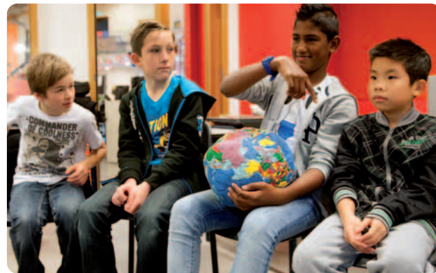
Op vreedzame scholen is de school een oefenplaats voor democratie.