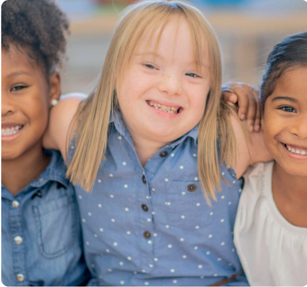
De Onderwijsraad adviseert om regulier en speciaal onderwijs dichter bij elkaar te brengen.

met een beperking ondersteunen en begeleiden bij de stap naar een vervolgopleiding, de arbeidsmarkt of een zorg-onderwijsvoorziening.