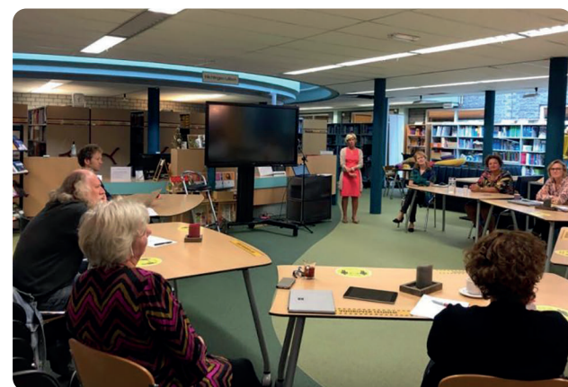
In debat over inclusief onderwijs.

Inclusief onderwijs is echt iets anders dan passend onderwijs. In het rapport Steeds inclusiever focust de Onderwijsraad op leerlingen met een beperking. Met een beperking bedoelt de raad een kenmerk of een aandoening die iemand kan belemmeren om deel te nemen aan bijvoorbeeld onderwijs. De beperking kan lichamelijk en/of mentaal zijn, en structureel of tijdelijk van aard.