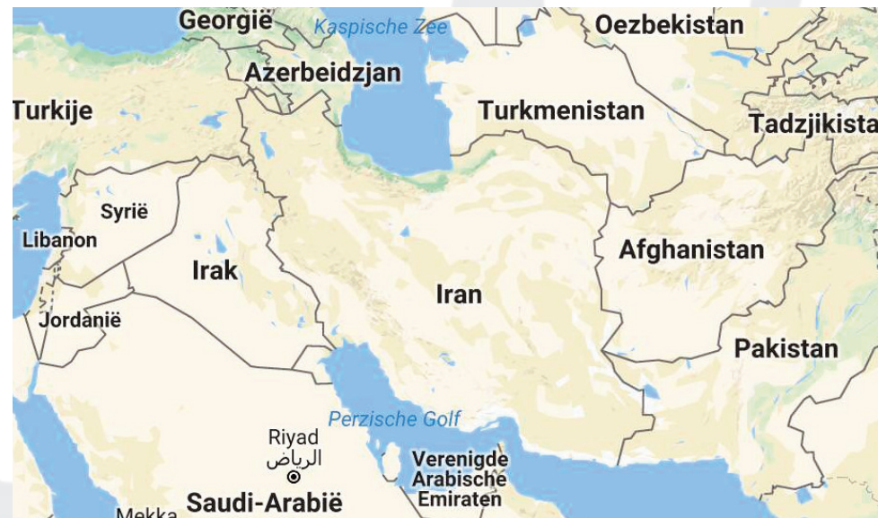
Kaart van Iran