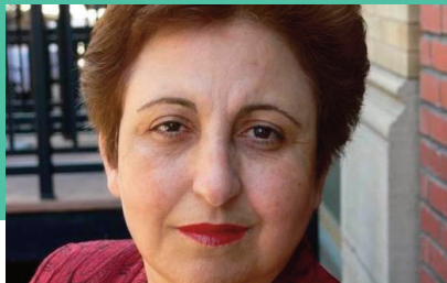
Shirin Ebadi Nobel Vredesprijswinnaar 2003

Shirin Ebadi werd geboren in 1947 en groeide op in een groot huis in Teheran, de hoofdstad van Iran. Haar huis had een binnenplaats vol bloemen en een klein zwembadje waar vissen zwommen. Op zomeravonden legden Shirin en haar broers en zussen hun bedden buiten om onder de sterrenhemel te slapen.